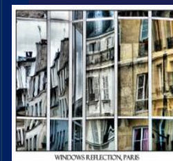
WINDOWS REFLECTION, PARIS