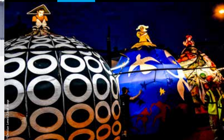
Compagnie Transe Express

Trois poupées géantes aux robes crinolines démesurées glissent à travers la foule, des tambours dans leurs jupons. Elles entonnent des mélodies qui envoûtent petits et grands 19h19 > 19h49