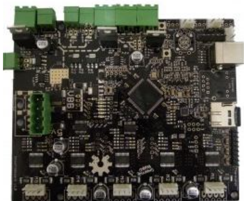
Carte de contrôle pour imprimantes 3D, découpeuses laser et fraiseuses CNC. Smoothieboard 5 axes

85 % des ventes en lignes de Robotseed sont réalisées à l'international. La société a été créée en mars.